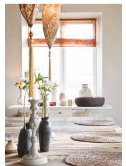
Små vaser och tallriksunderlägg från Tine K Home och betongljusstakar från Tove Adman.