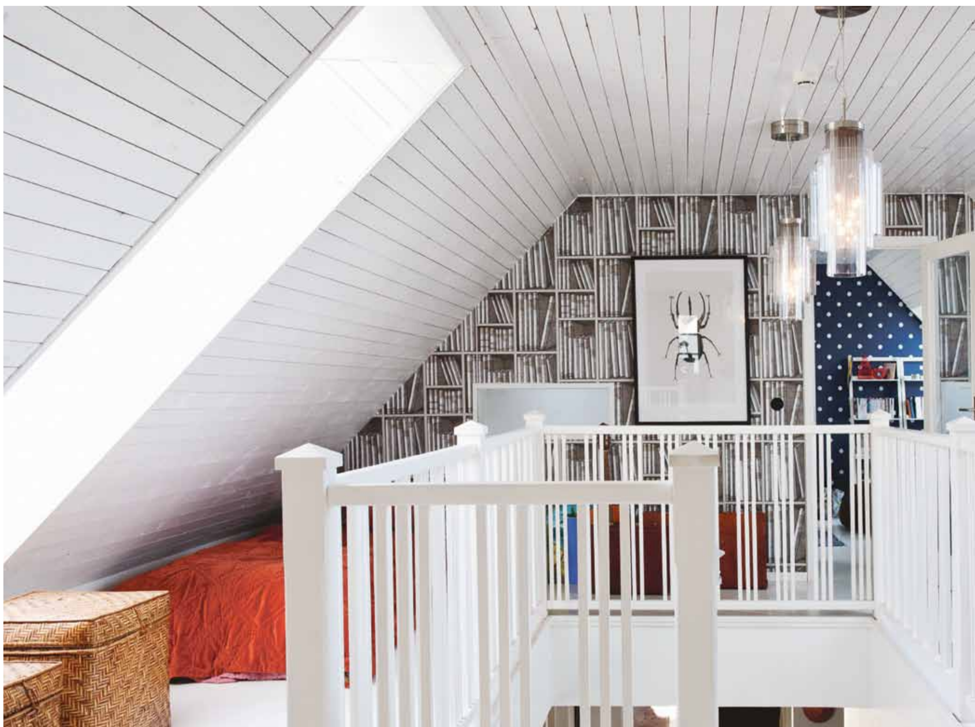
På andra våningen finns förutom sovrummen också detta öppna ljusa rum tapetsrad med tapeten Exlibris från Cole & Son. Skalbaggetavlan kommer från Hagendornhagen.