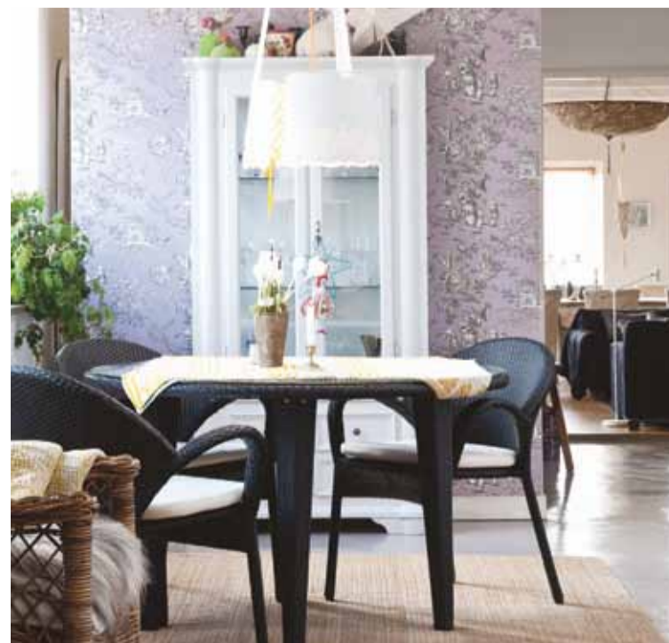
I anslutning till köket ligger matplatsen med stolar och bord från Homebase. Lampa från Pulpo och tapeten heter Mandarin Manuel Canovas.