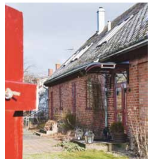
Det gamla huset mitt i byn Stora Köpinge är byggd av vacker skånsk tegel.