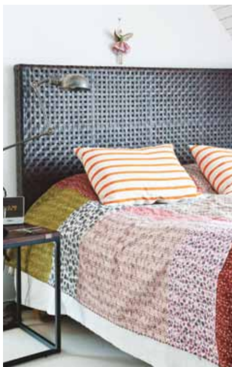
Sovrummet går i svart och vitt med färgglada textilier. Sänggavel Artwood, överkast från AnnaO och sänglampor från Nordal.