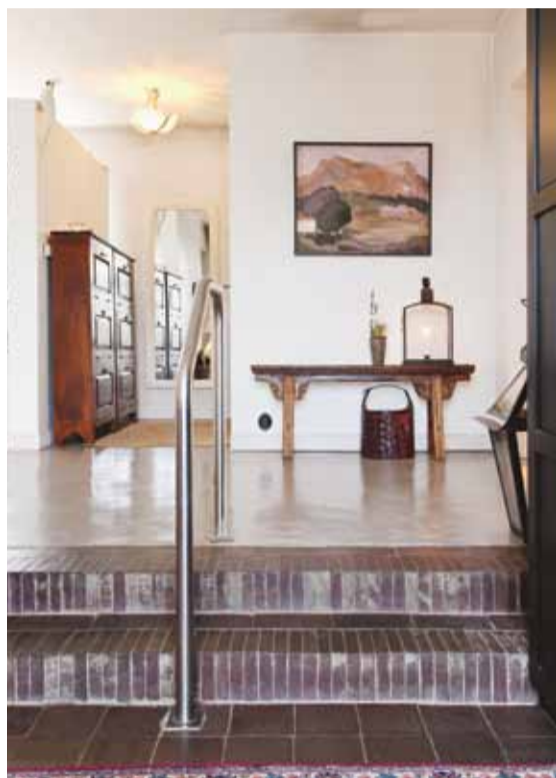
I hallen finns det gamla trappräcket fortfarande kvar sen tiden som skola. Den kinesiska bänken är inköpt under en shoppingresa till Köpenhamn. Ljuslykta från Tine K Home.